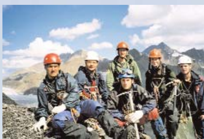
19 августа 2005 года.

Мы поднялись от верховьев ручья по морене, надели кошки и начали подъём к перевалу Кулагаш по одноимённому леднику.